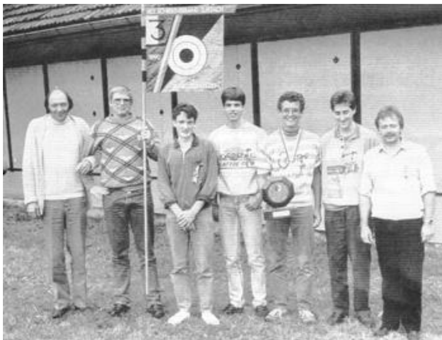
Erfolgreiche Döttinger Jungschützen mit ihren Leitern

Seit 1960 führen die Schützenvereine regelmässig Jungschützenkurse durch. Die von ausgebildeten Leitern geförderten jungen Leute sorgen immer wieder für schöne Resultate auf kantonaler und eidgenössischer Ebene. Die Feldschützengesellschaft weist 1976 einen Bestand von 214 Mitgliedern auf; 29 Burschen und ein Mädchen besuchen den Jungschützenkurs, dessen Höhepunkt das Wettschiessen, durchgeführt von der eigenen Sektion darstellt.