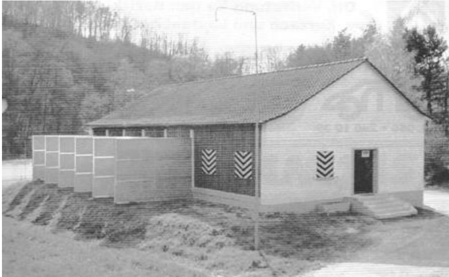
Das neue renovierte Schützenhaus