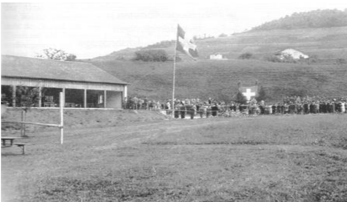
Feierliche Einweihung des Schützenhauses an der Surb im August 1957

„Nach einer verhältnismässig kurzen Bauzeit konnte über das vergangene Wochenende die neue Schiessanlage an der Surb mit ihren 14 Zugscheiben durch ein sehr gut besuchtes Eröffnungsschiessen definitiv in Betrieb genommen. Mehr als 1000 Schützen aus 48 Sektionen gaben den beiden durchführenden Vereinen die Ehre. Der Stand, mitten in satten, grünen Wiesen und Wäldern an der Surb, fand einhelliges Lob. Sowohl die technischen Einrichtungen wie auch das geräumige, massiv gebaute Schützenhaus mit der einzigartigen Schützenstube fand bei den sachverständigen Schützen grosse Interesse.“