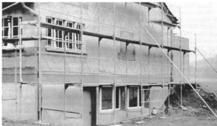
Während der Renovation des Schützenhauses